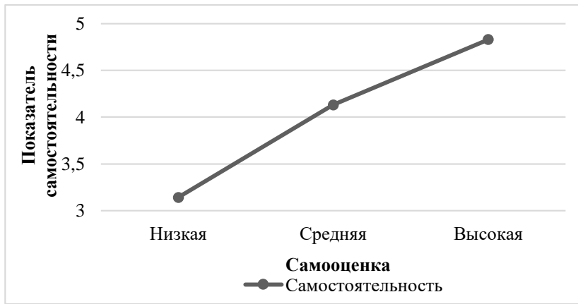
Рисунок 1 – График средних показателей: самооценка и самостоятельность

По данному графику видно, что у людей с низкой самооценкой наблюдается и низкий показатель самостоятельности ( M=3,14 ), в отличие от тех респондентов, у кого показатель самооценки личностных качеств как профессионала высокого уровня ( M=4,83 ). Результаты, полученные в ходе анализа, свидетельствуют о том, что люди с низкой оценкой собственных личностных качеств как профессионала сталкиваются с трудностями в организации активности и самостоятельного планирования деятельности. Именно поэтому можно предположить, что люди с высоким и средним уровнем самооценки смогли преодолеть сложности профессиональной карьеры, научившись регулировать собственное поведение и организовывать деятельность самостоятельно.