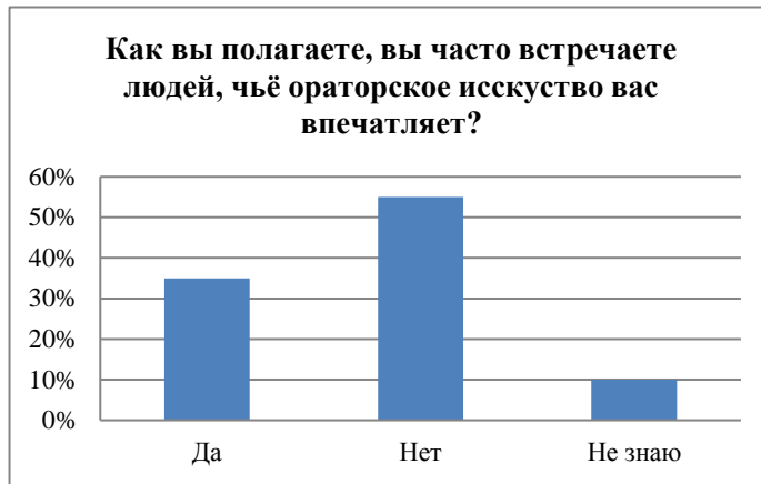
Гистограмма 11 – Распределение ответов на вопрос об ораторском искусстве и о людях, обладающих речевым мастерством

Одиннадцатый вопрос: как вы полагаете, вы часто встречаете людей, чье ораторское искусство вас впечатляет? 35% респондентов считают, что часто встречаются таких людей, 55% студентов – отрицают это, а 5% опрошенных затрудняются с ответом. Обратимся к гистограмме 11, где показаны ответы студентов.