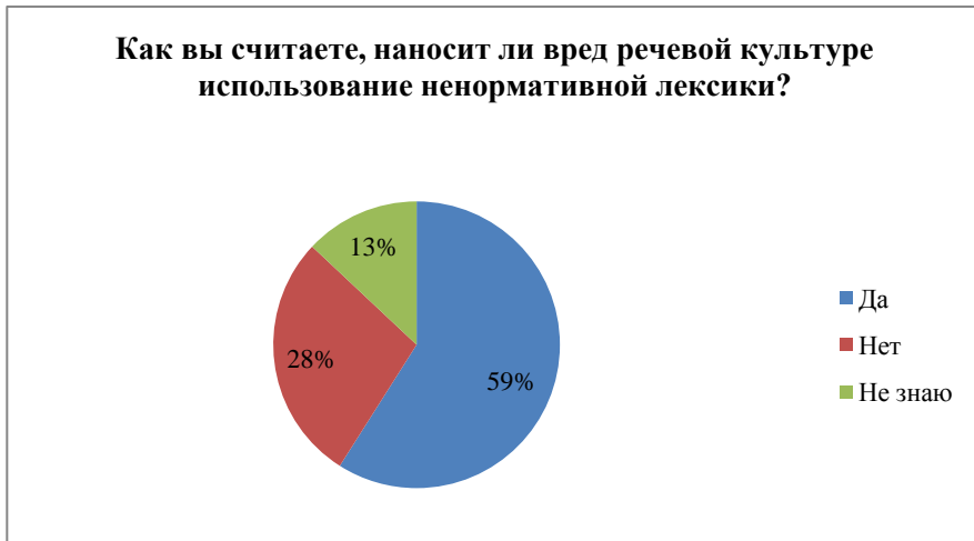
Диаграмма 3 – Распределение ответов на вопрос о вреде ненормативной лексики

Третий вопрос касался вреда использования ненормативной лексики для речевой культуры опрошенных респондентов. Большинство респондентов (59%) считают недопустимым использование ненормативной лексики, 28% – не согласны с этим высказыванием и 13% – воздержались от ответа.