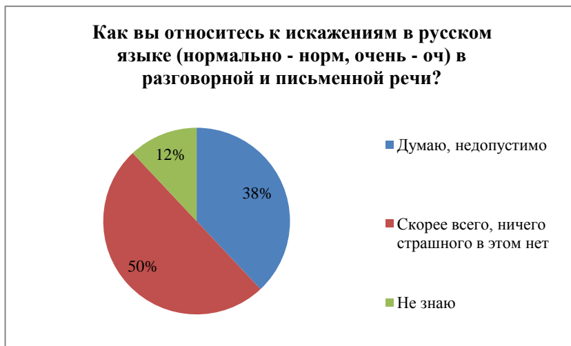
Диаграмма 6 – Распределение ответов на вопрос об умышленных искажениях в русском языке

Шестой вопрос касался умышленных искажений слов в русском языке (нормально – норм, очень – оч. и др.) в разговорной и письменной речи (социальные сети, Интернет, смс сообщения, включая голосовые и письменные). Большинство студентов (50% респондентов) считают, что ничего страшного в этом нет, 38% опрошенных не согласны с искажениями в русском языке и 12% ответивших не знают, как к этому относится. Обратимся к диаграмме 6, где наглядно представлены все ответы.