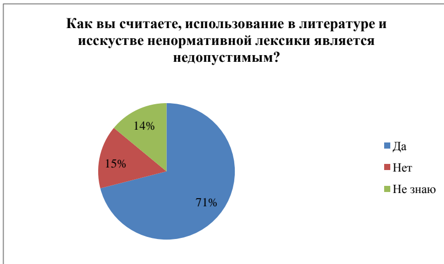
Диаграмма 4 – Распределение ответов на вопрос о вреде ненормативной лексики искусству и литературе

Четвертый вопрос был посвящен использованию ненормативной лексики в литературе и искусстве. Большинство сошлись во мнении, что ненормативная лексика недопустима к употреблению. Ответы распределились следующим образом: 71 % ответивших против использования ненормативной лексики, 15 % считают, что это допустимо, 14 % затрудняются с ответом.