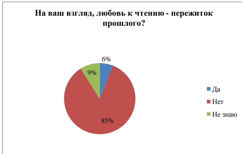
Диаграмма 7 – Распределение ответов на вопрос об отношении к чтению как пережитку прошлого

Седьмой вопрос был посвящен отношению респондентов к чтению: на ваш взгляд, любовь к чтению – это пережиток прошлого? Респонденты так ответили на этот вопрос: 85% респондентов не согласны с тем, что чтение не популярно в 21 веке, 9% опрошенных затрудняются с ответом на этот вопрос, 6% студентов считают, что чтение – пережиток прошлого. Диаграмма 7 подтверждает данные ответы.