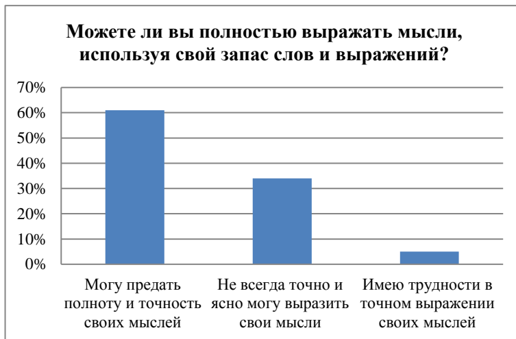
Гистограмма 9 – Распределение ответов на вопрос об умении выражать свои мысли, используя свой багаж слов и выражений

Девятый вопрос был следующим: можете ли вы эффективно и полноценно выражать мысли, используя свой багаж слов и выражений? Большинство респондентов (61%) считают, что могут передать полноту и точность своих мыслей, 34% – не всегда точно и ясно могут выразить свои мысли, а 5% – имеют трудности в точном выражении своих мыслей. Данная гистограмма позволит наглядно проследить за ответами студентов на рисунке 9.