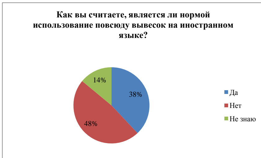
Диаграмма 5 – Распределение ответов на вопрос о повсеместном использовании вывесок на иностранном языке

Пятый вопрос звучал так: считаете ли вы нормой использование повсюду вывесок на иностранном языке? Ответы распределились следующим образом: 48 % ответивших против использования повсюду вывесок на иностранном языке, 38 % опрошенных считают, что это допустимо, 14 % затрудняются с ответом. Обратимся к диаграмме 5, где наглядно представлены ответы студентов.