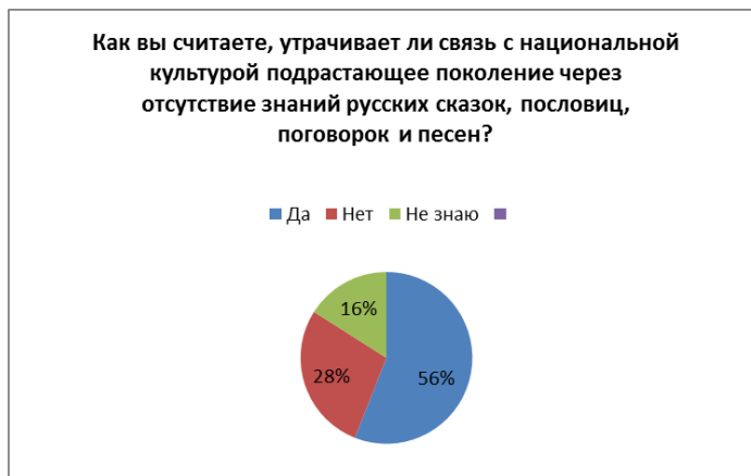
Диаграмма 12 – Распределение ответов на вопрос об утрате связи с национальной культурой через отсутствие знания русских сказок, пословиц, поговорок и народных песен

Двенадцатый вопрос связан с отношением подрастающего поколения к утрате связи с национальной культурой через отсутствие знания русских сказок, пословиц, поговорок и народных песен. Модернизация образования и его трансформация не должна быть проведена по западному образцу в ущерб национальной культуре и будущим поколениям, что впоследствии приведет к замене настоящих духовных ценностей. Ответы распределились следующим образом: 56% респондентов считают, что молодое поколение утрачивает свои корни через отсутствие знания русских сказок, пословиц, поговорок и народных песен, 28% студентов против этого высказывания и 16% опрошенных затрудняются с ответом на данный вопрос. Таким образом, «вызовы, характерные для начала 21 века непосредственно связаны с глобализацией общества и изменениями, происходящими не только в научно-технической области [15], но и в сфере морально-этических норм, формируя духовные ценности будущего поколения» [5, с. 109], и не случайны ответы больше половины респондентов высказаны за опасения об утрате связи с национальной культурой.