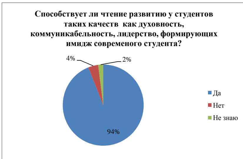
Диаграмма 8 – Распределение ответов на вопрос о развитии посредством чтения таких качеств у студентов как духовность, коммуникабельность, лидерство, формирующих имидж современного студента

Восьмой вопрос звучал так: способствует ли чтение развитию таких качеств у студентов как духовность, коммуникабельность, лидерство, формирующих имидж современного студента? Ответы были следующими: 94% респондентов считают, что чтение способствует развитию духовности, коммуникабельности и лидерских качеств; 4% не согласны с этим мнением; 2% затрудняются с ответом.