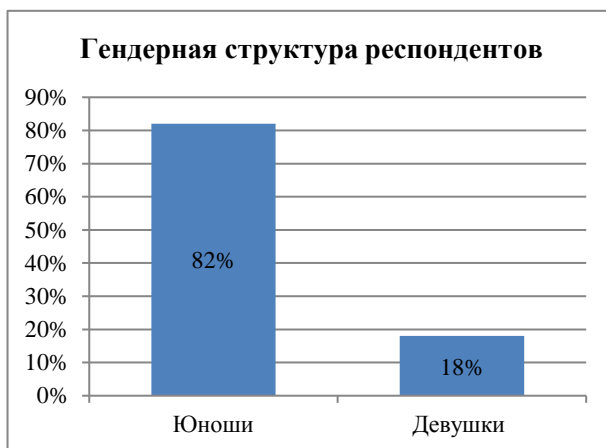
Гистограмма 1 – Распределение ответов на вопрос о гендерной структуре опрошенных респондентов

Второй вопрос касался курса обучаемых студентов. Оказалось, что более активными были студенты второго курса – 60%. Количество студентов первого курса составило 18%, третьего курса – 12%, четвертого курса – 10% респондентов. Гистограмма 2 подтверждает данные ответов студентов.