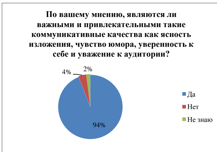
Диаграмма 10 – Распределение ответов на вопрос о важности таких коммуникативных качеств как ясность изложения хода мысли, чувство юмора, уверенность в себе и уважение к аудитории

Десятый вопрос: по вашему мнению, являются ли важными и привлекательными такие коммуникативные качества как ясность изложения хода мысли, чувство юмора, уверенность в себе и уважение к аудитории? Большинство респондентов (94% студентов) согласны с этим положением дел, 4% опрошенных высказались против и 2% затрудняются ответить на данный вопрос. Детально в виде круговой диаграммы просмотреть ответы можно на диаграмме 10.