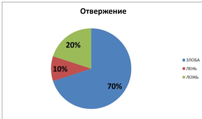
Рисунок 2 – Характеристика отрицательных чувств таких, как злоба, лень, ложь у детей с общим недоразвитием речи

Результаты методики «Цветовой тест отношений»