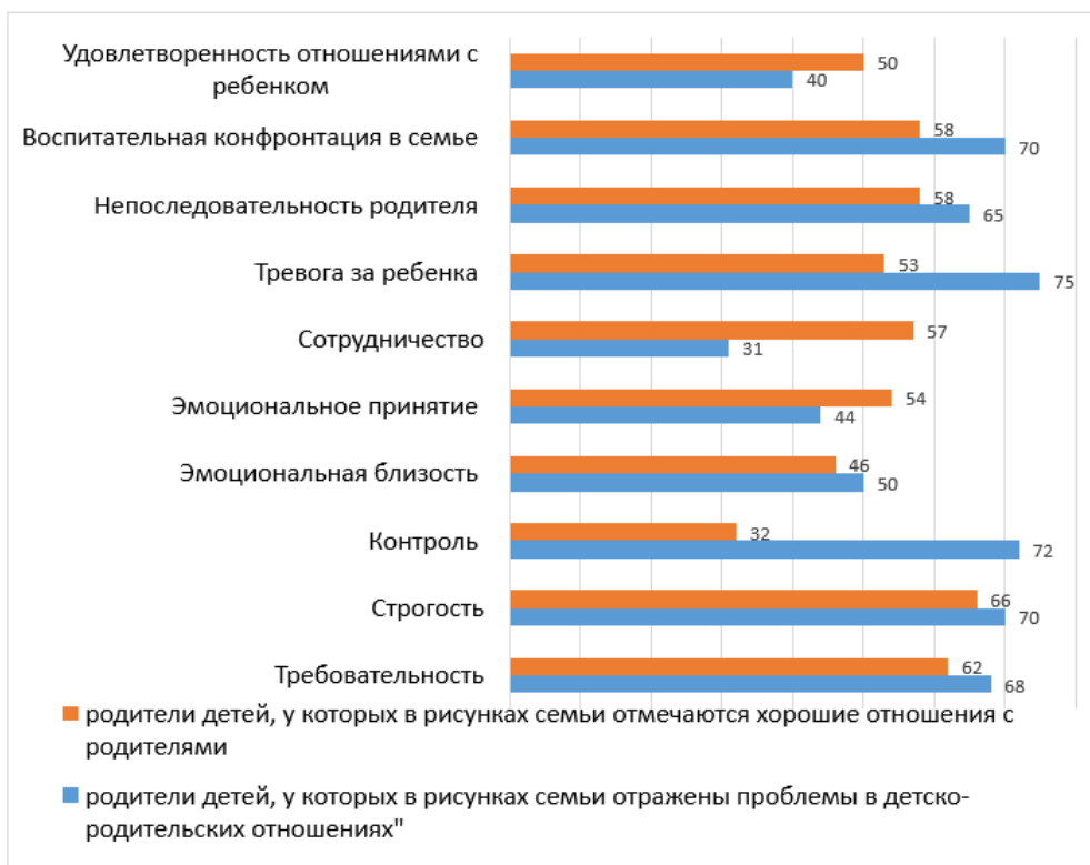
Рисунок 2 – Взаимодействие родителей с одаренными детьми дошкольного возраста

Результаты взаимодействия родителей с одаренными детьми на ранних возрастных этапах проявляются в особенностях взаимодействия с социальной средой в более старшем возрасте. Для оценки личности одаренных подростков и взрослых – «бывших одаренных детей», была использована методика «Опросник социально-психологической адаптации» (СПА). К. Роджерса и Р. Даймонд [9]. Опрос сопровождался беседой в процессе психологического консультирования, было опрошено 40 подростков 15-17 лет и 40 взрослых 25-45 лет. На основании показателей шкалами методики выявлены: адаптивность ниже нормы – у 65% исследуемых подростков, эмоциональный комфорт ниже нормы – у 37,5%, доминирование выше нормы – у 57,5%, эскапизм (уход от проблем) выше нормы – у 60% подростков.