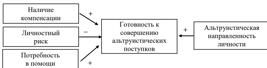
Рисунок 1 – Модель исследования

Модель исследования представлена на рисунке 1. Плюсы отражают положительные взаимосвязи между явлениями, а минусы – отрицательные.